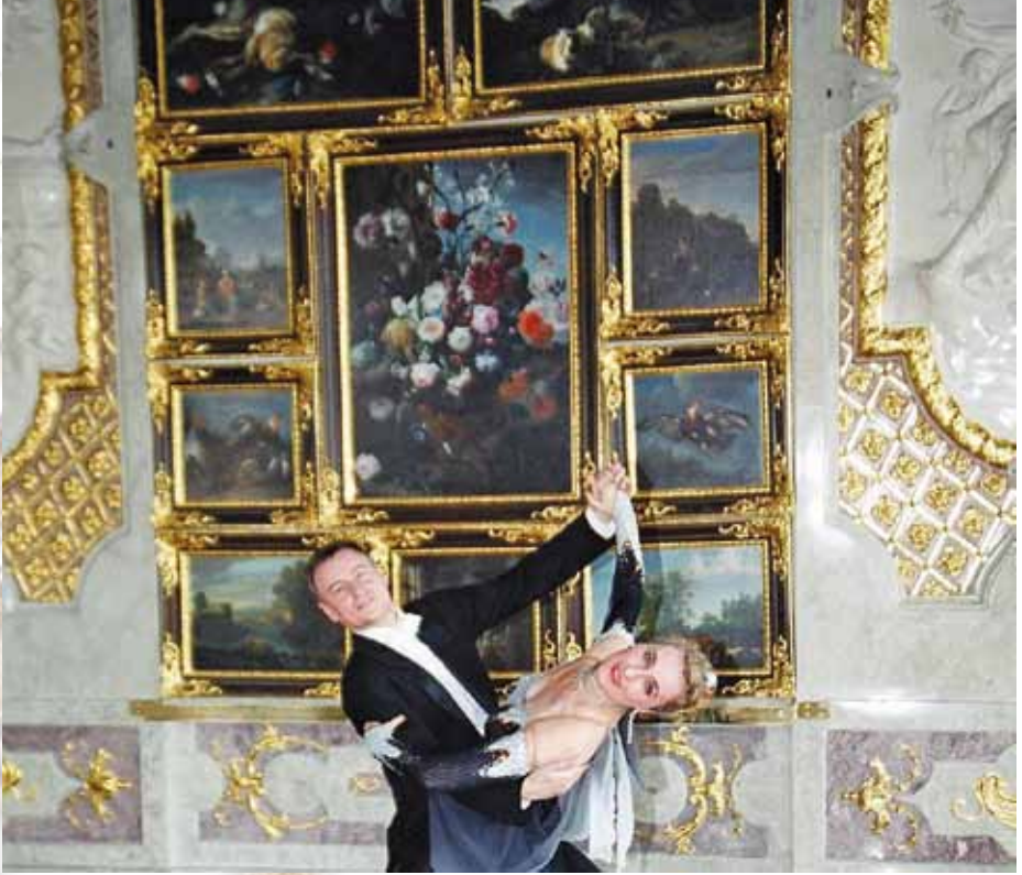
Palais Schwarzenberg, Wien