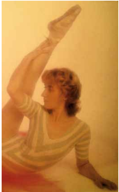
Mit Ballett hat alles begonnen