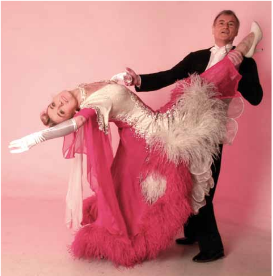
Showfiguren wie diese sind im Wettkampf nicht erlaubt

Preisaufwändigste. Ein Frack wird einmal erstanden und dann oft viele Jahre getragen; die Turnierkleider werden immer wieder weitergegeben, so dass sie schließlich recht günstig übernommen werden können. Damentanzschuhe aus Satin lassen sich nach Bedarf umfärben. Auch die Accessoires müssen nicht teuer sein, Fantasie in der Kombination ist dabei von Vorteil. Ein bekannter Trainer und Choreograf hat jedenfalls bemerkt, der alljährliche Schiurlaub käme ihm teurer als der Tanzsport!