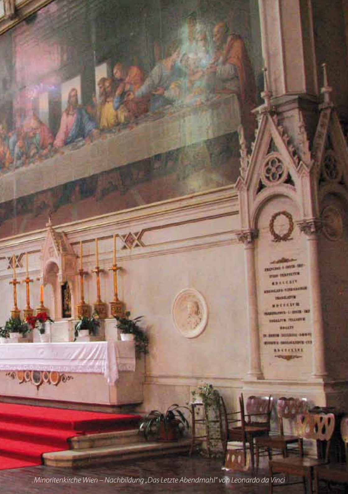
Minoritenkirche Wien – Nachbildung „Das Letzte Abendmahl“ von Leonardo da Vinci