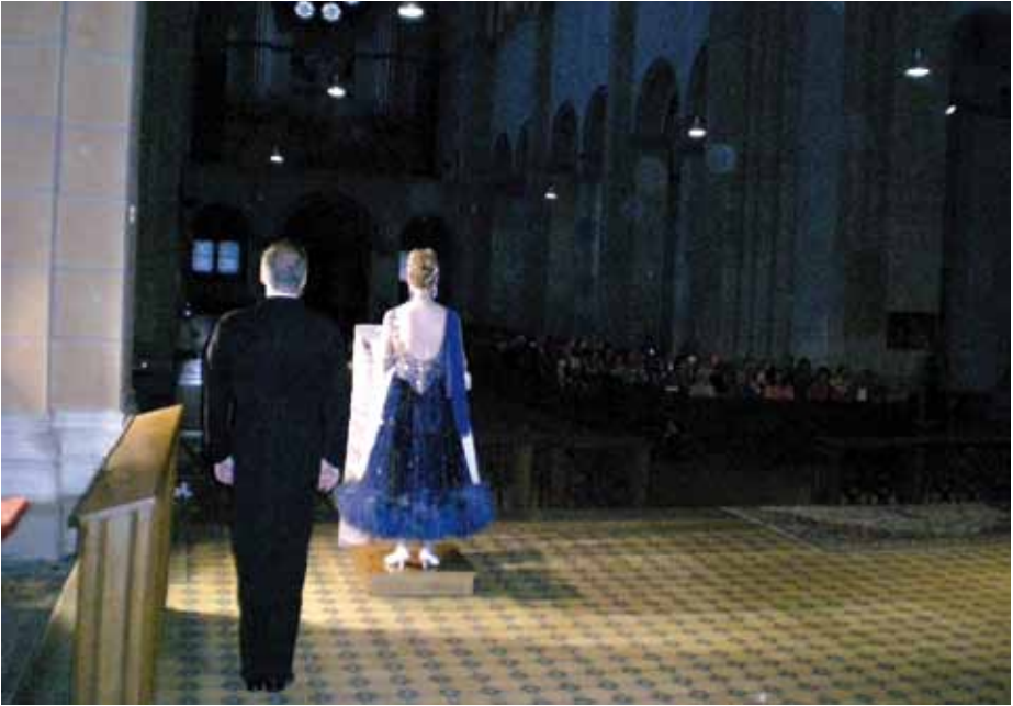
Kaiserjubiläumskirche der Trinitarier, Wien, Mexikoplatz