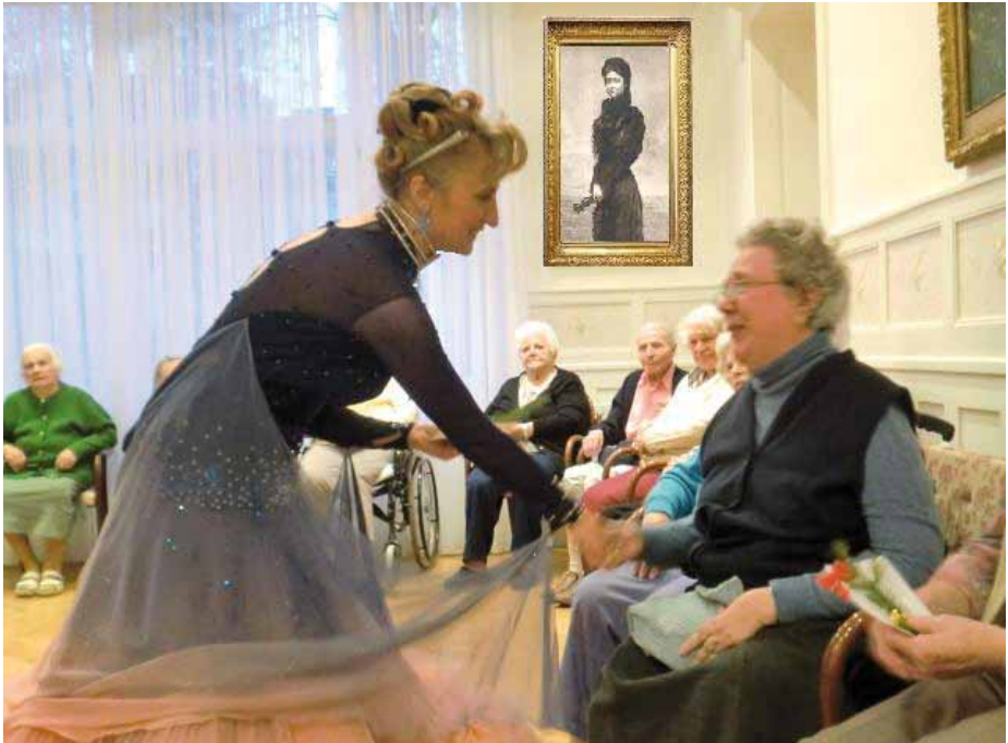
Haus Schönbrunn der Caritas Wien